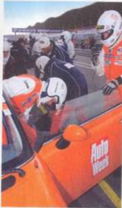
Eerst de rijderswissel, dan tanken. Omdat de Mini's vaker aan de pomp staan dan de dieselende Seats, moeten er meer pitstops worden gemaakt.

e, maar weet zich in drie en naar de zesde plaats. Helaas mist onze Mini id en als ik het stuur na em overneem, heeft ie sen weer prijs moeten den van de pitstraat saaks rechtsaf en beland le vechtende Ibiza's. Bij i nieuwe chicane krijg ik chterkant en via de m'n weg. Die beuk uitzondering; over het fair gereden. Als je een ende Seat gewend bent, koek in een Mini. Je or in de toeren (iets n) waardoor je veel bt in een echte race- je gevoel gaat het arder dan in de Ibiza, schijn is; de ronde- et zo veel. Het grootste leze twee auto's is dat er door de bocht kunt wegligging en strakkere rats, met hun hogere iet uitaccellereren.