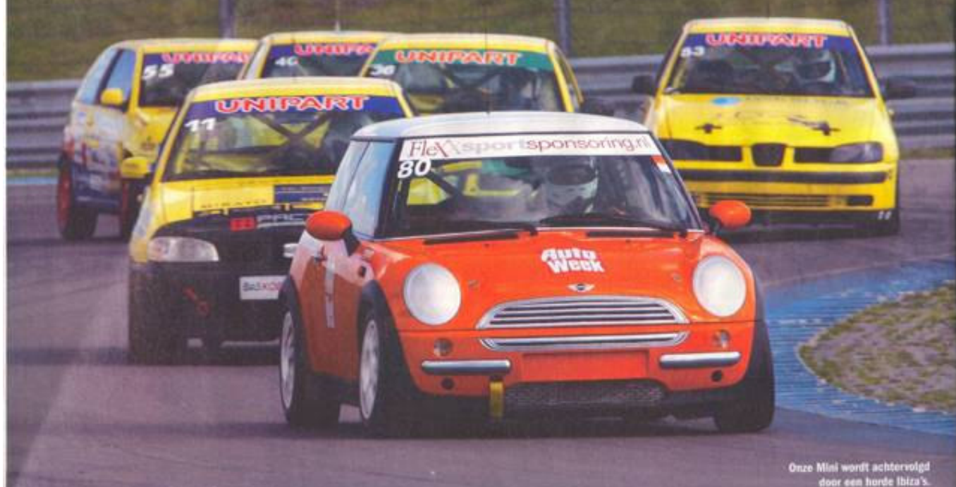
Onze Mini wordt achtervolgd door een horde Ibiza's.

riskeus is een Mini al een feest om mee te rijden, wanneer je de kans krijgt om er op het circuit mee op te strijden neem ik plaats achter het stuur van de knaflener 80. Onze missie: na 5 uur racen zo hoog mogelijk sement eindigen. Wordt het oranje boven?