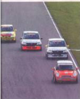
Op Assen reden de Mini's, Seats Ibiza en